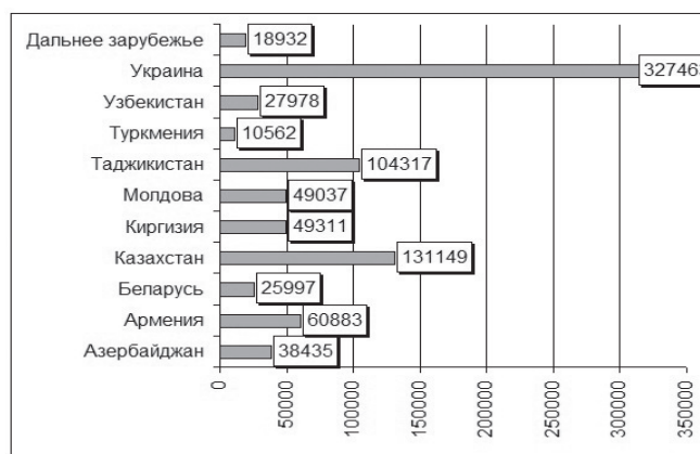
Рис. 1 Миграционный приток в Российскую Федерацию по странам за 2015-2018 гг.

Как мы видим, миграционный поток в РФ из стран СНГ значительно превышает поток из т.н. дальнего зарубежья. Можно сказать, что ежегодный прирост населения за счёт официальной миграции колеблется между одной и двумя десятками процента. Украина с Белоруссией дают почти половину величины официального притока.